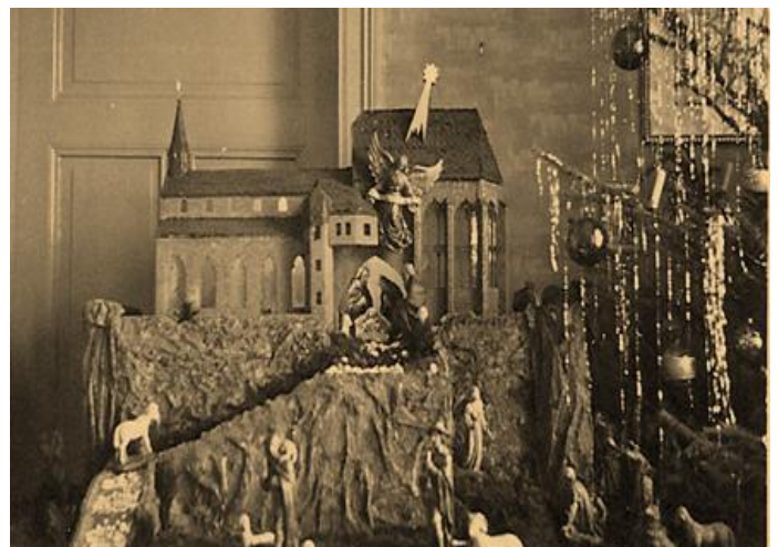
Eine Höchster Weihnachtskrippe, wohl noch vor dem Krieg, die die Justinuskirche zum Vorbild hatte