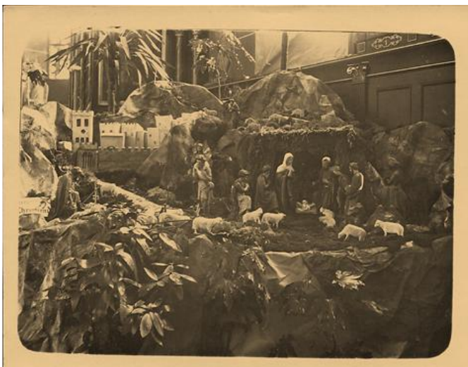
Die alte Krippe der Justinuskirche vor den großen Renovierung der 30er Jahre, rechts vorne vor dem Chorgestühl